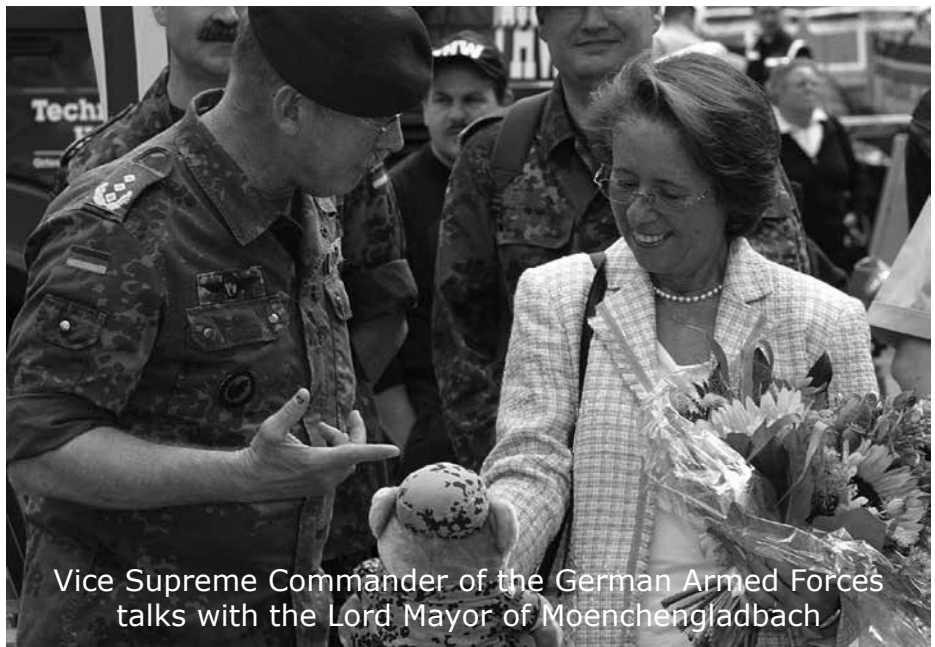
Vice Supreme Commander of the German Armed Forces talks with the Lord Mayor of Moenchengladbach

schluss waren die beiden Motive, warum die Reservistenkameradschaft Mönchengladbach im November 1984 gemeinsam mit dem Verteidigungskreiskommando 321 Düsseldorf den IMM aus der Taufe hob. Die erste Siegermannschaft bestand aus drei Nationen (BE, GB, GE) und kam vom Stab der NATO-Heeresgruppe Nord (NORTHAG). In einer Welt voll Amtsschimmel und hoher Hierarchie-Hürden hätte es den IMM eigentlich gar nicht geben dürfen.