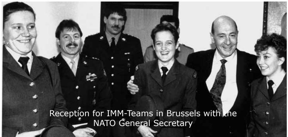
Reception for IMM-Teams in Brussels with the NATO General Secretary

waren in Gladbach vier internationale Hauptquartiere stationiert) und eine gezielte positive Öffentlichkeitsarbeit für die Bundeswehr im Großraum Niederrhein nach dem sehr heftig geführten Streit um den NATO Doppelbe-