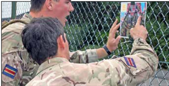
● A British team identifying one of the 45 pictures of NATO and foreign uniforms – just one of the 14 challenging tasks of the IMM

"Those who are sent on missions side by side must be able to blindly rely on