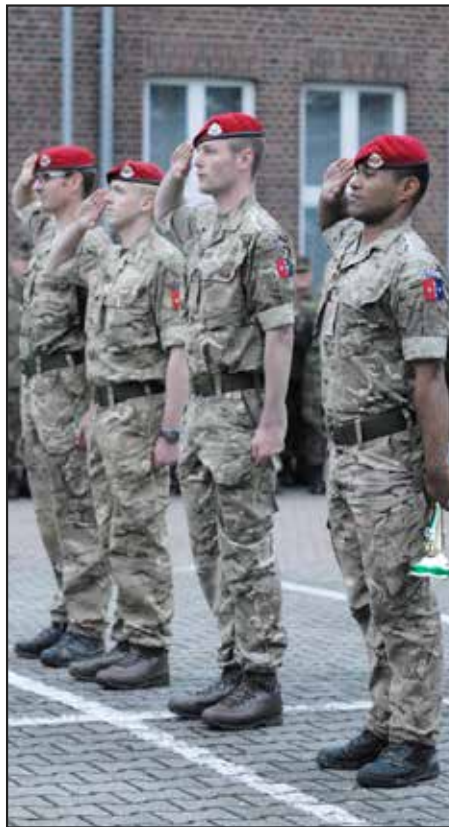
● The best British team, the Special Investigation Branch of the RMP lined up during the award ceremony