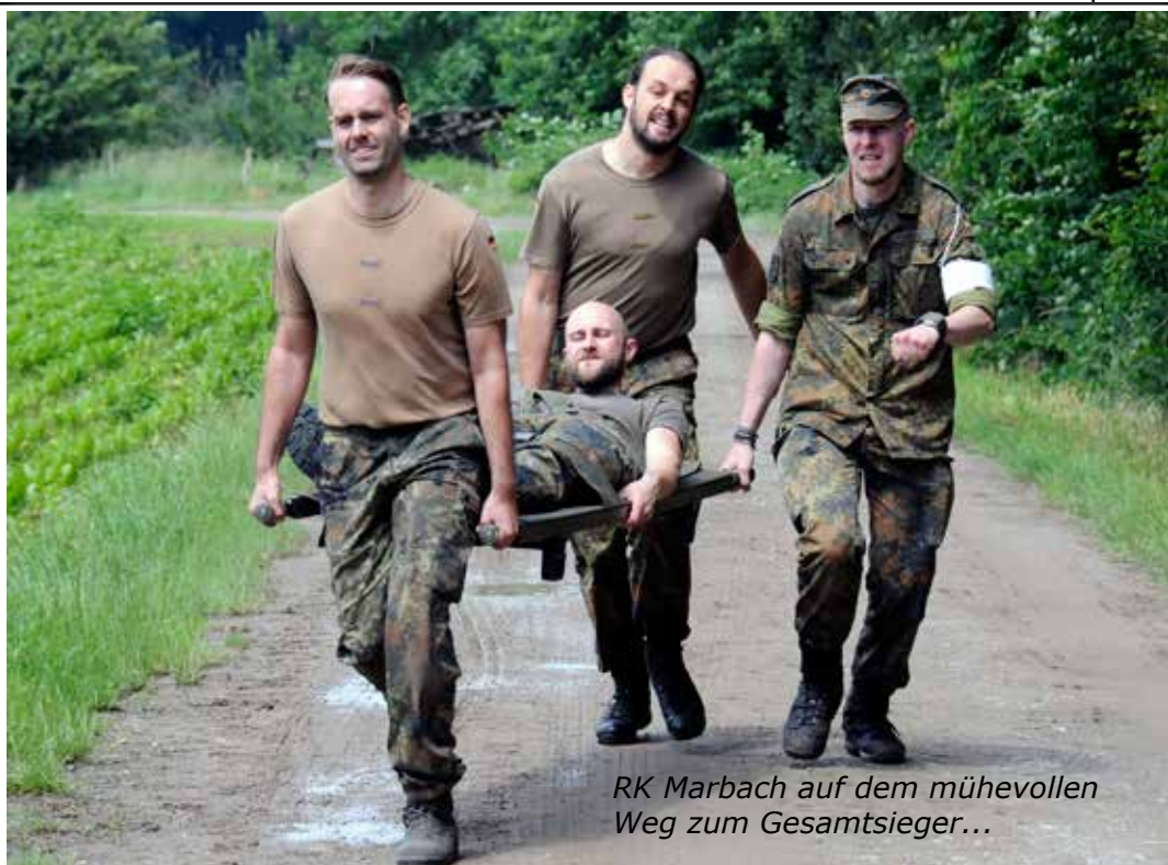
RK Marbach auf dem mühevollen Weg zum Gesamtsieger...