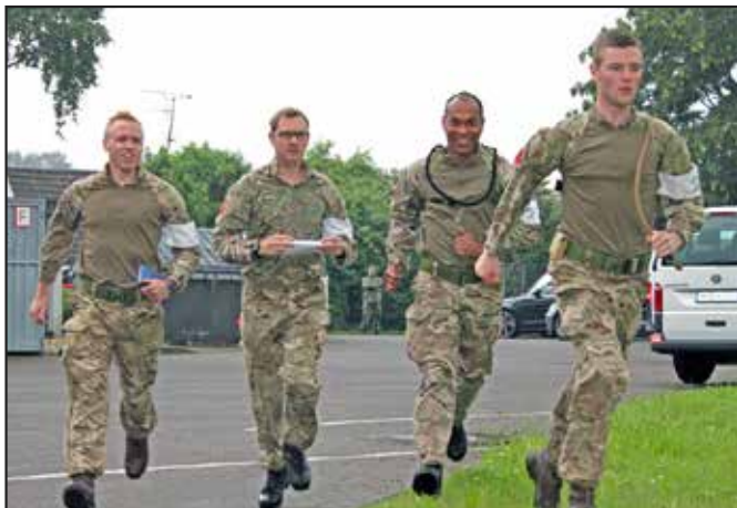
● The British top team speeds up during the IMM