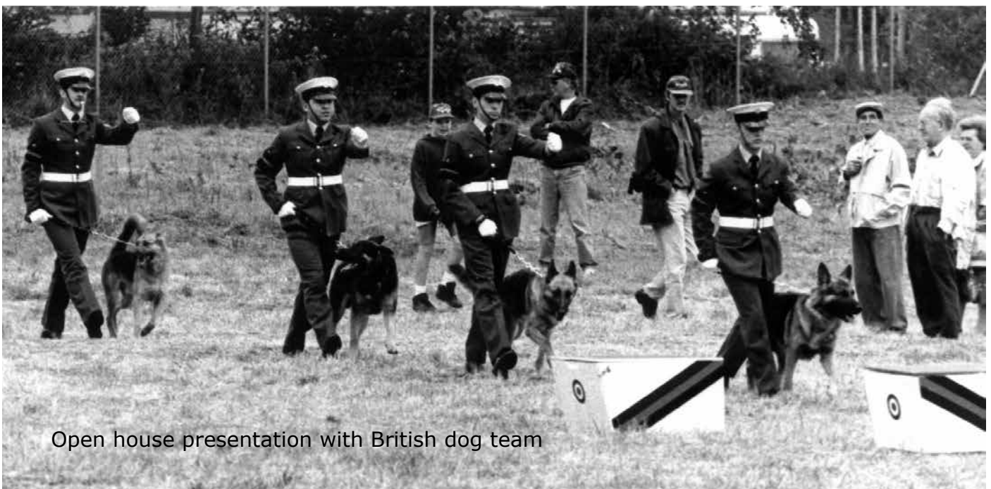
Open house presentation with British dog team

Am 1. IMM, zu dem bis zu 15 Mannschaften erwartet wurden, nahmen - nach ungewöhnlicher Werbe-Tournee der Organisatoren durch die damals am Niederrhein noch zahlreicheren Kasernen - gleich 32 Trupps aus sechs Nationen teil.