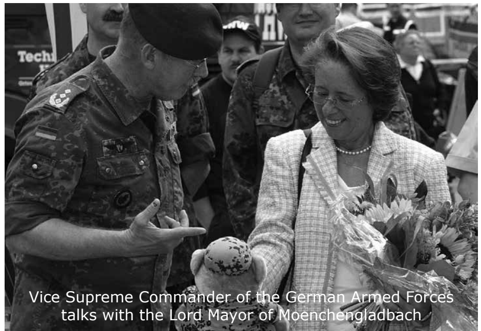
Vice Supreme Commander of the German Armed Forces talks with the Lord Mayor of Moenchengladbach

wehr im Großraum Niederrhein nach dem sehr heftig geführten Streit um den NATO Doppelbeschluss waren die beiden Motive, warum die Reservistenkameradschaft Mönchengladbach im November 1984 gemeinsam mit dem Verteidigungskreiskommando 321 Düsseldorf den IMM aus der Taufe hob. Die erste Siegermannschaft bestand aus drei Nationen (BE, GB, GE) und kam vom Stab der NATO-Heeresgruppe Nord (NORTHAG). In einer Welt voll Amts-