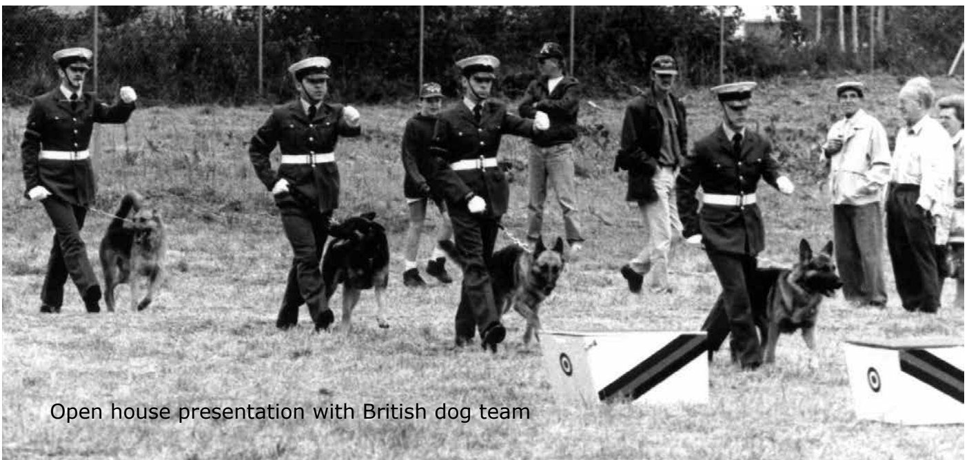
Open house presentation with British dog team

Am 1. IMM, zu dem bis zu 15 Mannschaften erwartet wurden, nahmen - nach ungewöhnlicher Werbe-Tournee der Organisatoren durch die damals am Niederrhein noch zahlreichen Kasernen - gleich 32 Trupps aus sechs