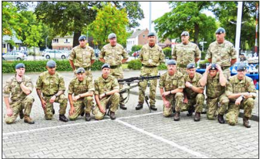
● 609 West Riding Squadron RAF Team II, from North Yorkshire

The 35th IMM, which will be organised by the Mönchengladbach Reserve soldiers and the Landeskommmando Nordrhein-Westfalen of the Bundeswehr, is scheduled to take place on June 30, 2018.