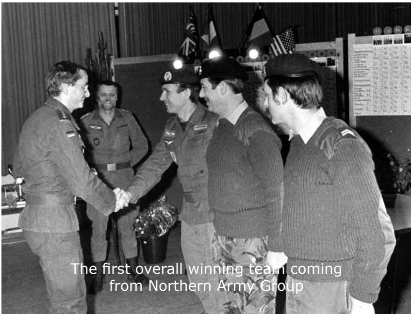
The first overall winning team coming from Northern Army Group

Generalleutnant Hans-Heinrich Dieter. Ein weiteres "besonderes Vorkommnis" war 1990 der Besuch der letzten offiziellen NVA-Delegation in der Geschichte der DDR (auf Vermittlung des Bundesverteidigungsministeriums). Es kam zu bewegenden deutschdeutschen Szenen. Es war schon ein Hauch Geschichte, als ein vom offiziellen Feindbild geprägter DDR-Offizier unter Tränen bekannte, erst hier habe er eine „echte Volksarmee“ kennengelernt. Das Jubiläum 25 Jahre IMM wurde 2008 mit 18.000 Zuschauern im Rahmen des 25. NATO-Musikfestes gefeiert. In diesem Jahr werden es 36 Jahre IMM sein.