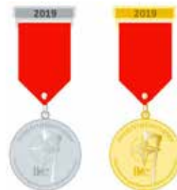
Medal for every participant, Competitors golden, supporters silver.