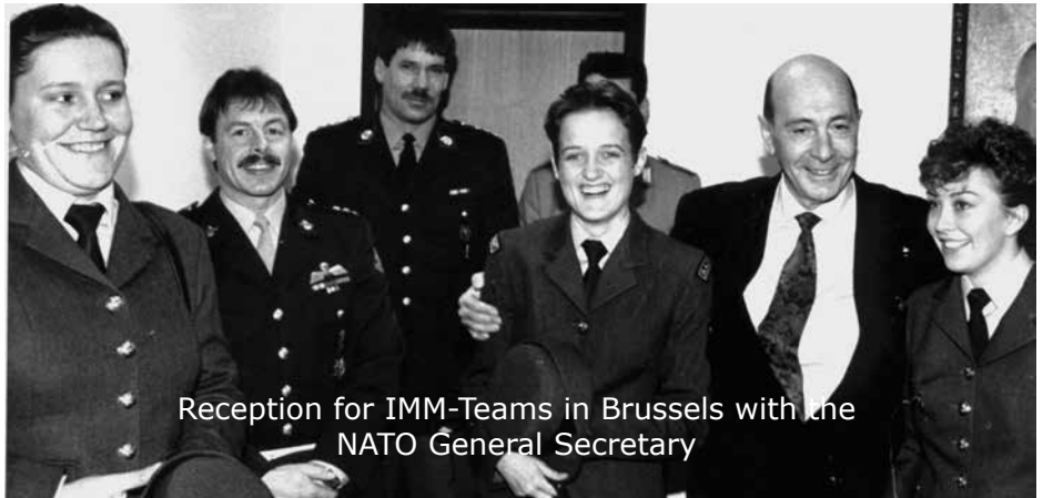
Reception for IMM-Teams in Brussels with the NATO General Secretary

Die Förderung interalliiert Kontakte (damals waren in Gladbach vier internationale Hauptquartiere stationiert) und eine gezielte positive Öffentlichkeitsarbeit für die Bundes-