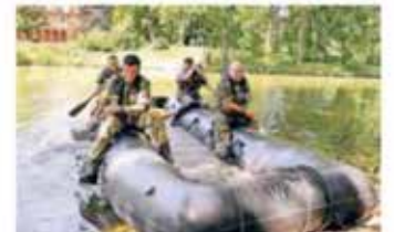
Vier Soldaten fahren mit ihrem Schlauchboot vor der maritimen Kallise von Schloss Rheydt.

Gedankenspiel, wie wohl der damalige Schlossherr Otto von Bylandt reagiert hätte, wenn er mit so vielen ausländischen Soldaten konfrontiert worden wäre: „Vermutlich hätte er seine Arkebuse gespannt.“ Statt mit einer solchen mittelalterlichen Büchse schossen die 132 Wettkämpfer beim Biathlon auf der Schlosswiese mit Laser-Pistolen auf elektronische Zielscheiben.