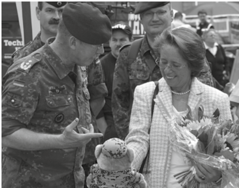
The Vice Supreme Commander of the German Armed Forces talks with the Lord Mayor.