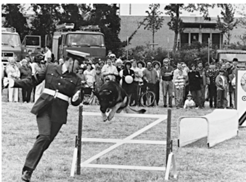
Open house presentation with British dog team 1993 at Moenchengladbach airport.

Die Förderung interalliiertes Kontakte (damals waren in Gladbach vier internationale Hauptquartiere stationiert) und eine gezielte positive Öffentlichkeitsarbeit für die Bundeswehr im Großraum Niederrhein nach dem sehr heftig geführten Streit um den NATO Doppelbeschluss waren die beiden Motive, warum die Reservistenkameradschaft Mönchengladbach im November 1984 gemeinsam mit dem Verteidigungskreis-kommando 321 Düsseldorf den IMM aus der Taufe hob. Die erste Siegermannschaft bestand aus drei Nationen (BEL, GBR, DEU) und kam vom Stab der NATO-Heeresgruppe Nord (NORTHAG).