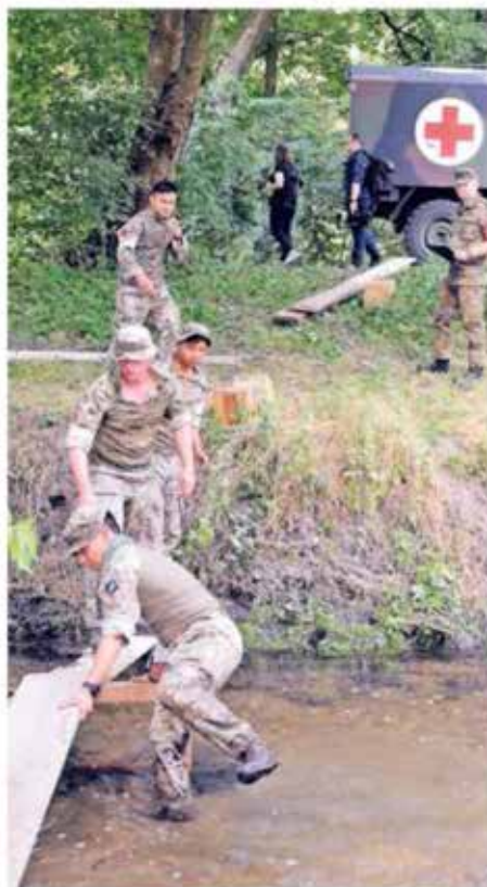
Zahlreiche internationale Teams nahmen am Samstag beim internationalen Militärwettkampf an Schloss Rheydt teil.