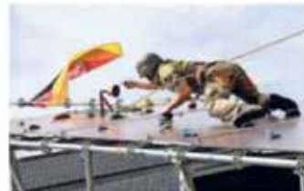
Auch ein baumhoher Kletterturm gehörte zu den Herausforderungen beim IMM.