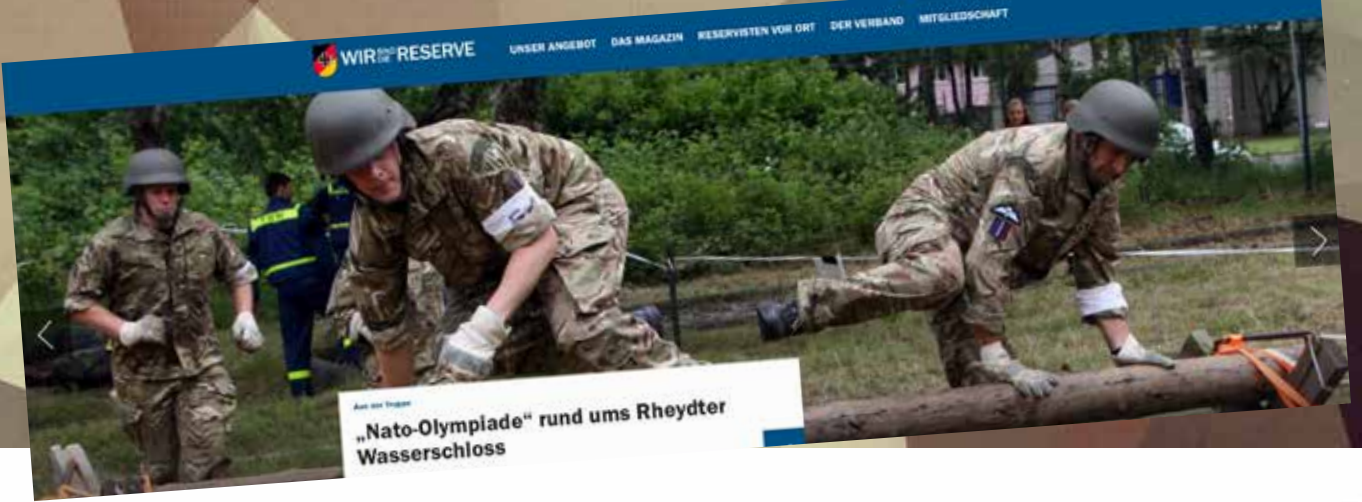
Aus der Tradition „Nato-Olympiade“ rund ums Rheydter Wasserschloss