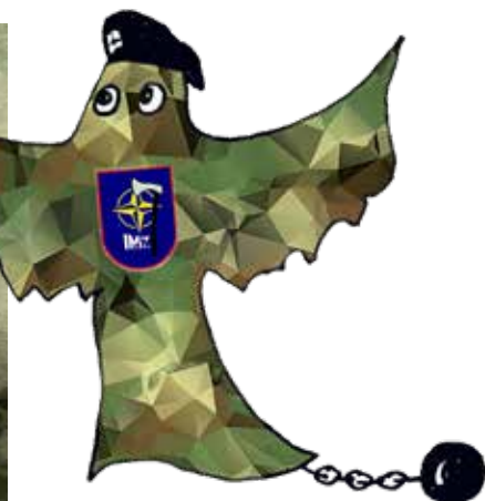
Das Allerletzte: Unser Schlossgespenst. Lust, mit ihm am 2. Oktober im Schloss Rheydt zu spuken?