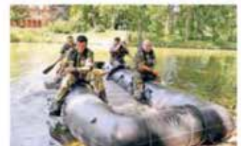
Vier Soldaten fahren mit ihrem Schlauchboot vor der malerischen Kasse von Schloss Rheydt.

Gedankenspiel, wie wohl der damalige Schlossherr Otto von Bylandt reagiert hätte, wenn er mit so vielen ausländischen Soldaten konfrontiert worden wäre. „Vermutlich hätte er seine Arkebuse gespannt.“ Statt mit einer solchen mittelalterlichen Büchse schossen die 132 Wettkämpfer beim Biathlon auf der Schlosswiese mit Laser-Pistolen auf elektronische Zielscheiben.