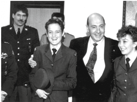
Reception for IMM-Teams in Brussels with NATO General Secretary Mr. Woerner.