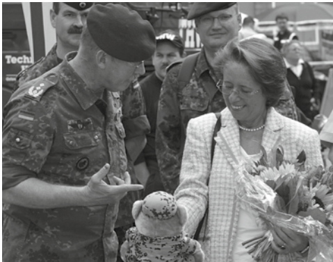
The Vice Supreme Commander of the German Armed Forces talks with the Lord Mayor.