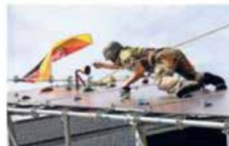
Auch ein baumhoher Kletterturm gehörte zu den Herausforderungen beim IMM.