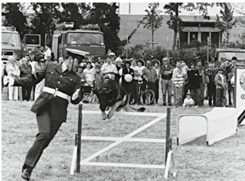
Open house presentation with British dog team 1993 at Mönchengladbach airport.

Die Förderung interalliierten Kontakte (damals waren in Gladbach vier internationale Hauptquartiere stationiert) und eine gezielte positive Öffentlichkeitsarbeit für die Bundeswehr im Großraum Niederrhein nach dem sehr heftig geführten Streit um den NATO Doppelbeschluss waren die beiden Motive, warum die Reservistenkameradschaft Mönchengladbach im November 1984 gemeinsam mit dem Verteidigungskreis-kommando 321 Düsseldorf den IMM aus der Taufe hob. Die erste Siegermannschaft bestand aus drei Nationen (BEL, GBR, DEU) und kam vom Stab der NATO-Heeresgruppe Nord (NORTHAG).