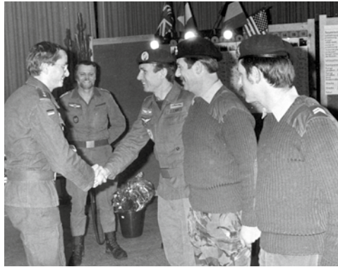
The first overall winning team 1984 and 1985 coming from Northern Army Group.