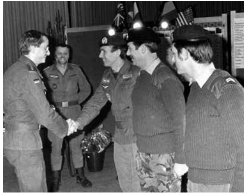
The first overall winning team 1984 and 1985 coming from Northern Army Group.