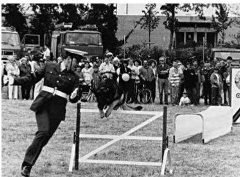
Open house presentation with British dog team 1993 at Moenchengladbach airport.