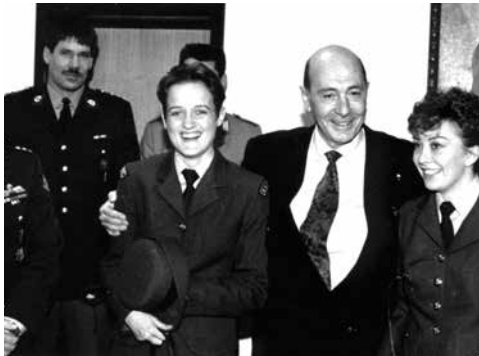
Reception for IMM-Teams in Brussels with NATO General Secretary Mr. Woerner.