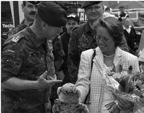
The Vice Supreme Commander of the German Armed Forces talks with the Lord Mayor.